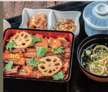
うみべ名物穴子ちらし御膳