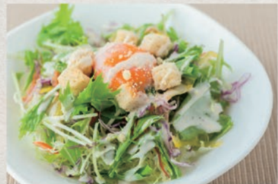
シーザーサラダ 727円 (税込800円)