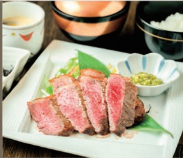
高森牛レアステーキ御膳