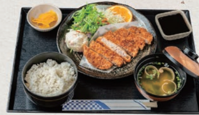
三元豚とんかつ定食