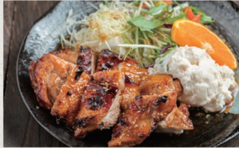
若鶏の塩焼き 909円(税込1000円)