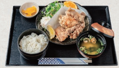
若鶏の唐揚げ定食