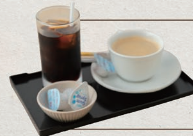
ソフトドリンクセット ※デザートと一緒にご注文いただけます。 273円(税込300円)