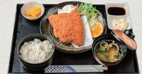
大アジフライ定食