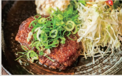
和風おろしハンバーグ 1000円(税込1100円)