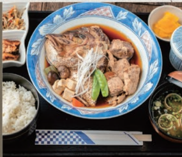
漁師の荒炊き御膳