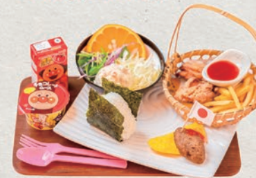
お子様御膳 818円 (税込900円)