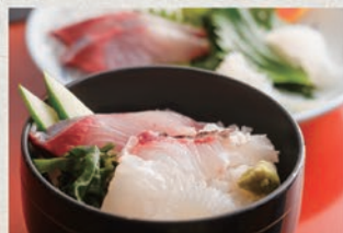
そのままのっけて、素材の味を楽しめる海鮮丼◎