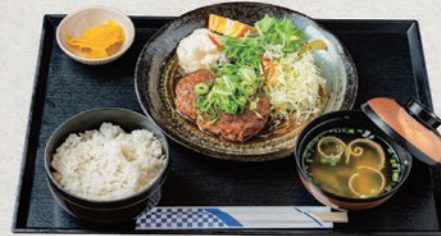
おろしハンバーグ定食