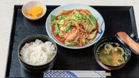
豚ロースの生姜焼き定食