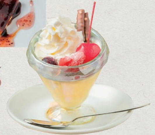
海峡昭和プリン 455円(税込500円)