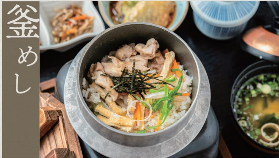
長州鶏釜めし御膳