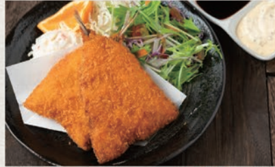
大アジフライ 909円 (税込1000円)