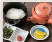
御膳セット 864円(税込950円) ごはん・みそ汁・茶碗蒸し・ 小鉢2種・漬物