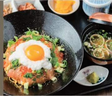
海の幸山掛け漬け丼御膳