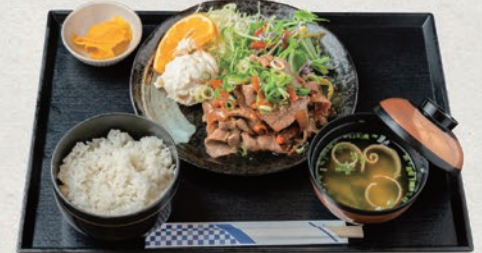
厚切り豚バラの焼肉定食