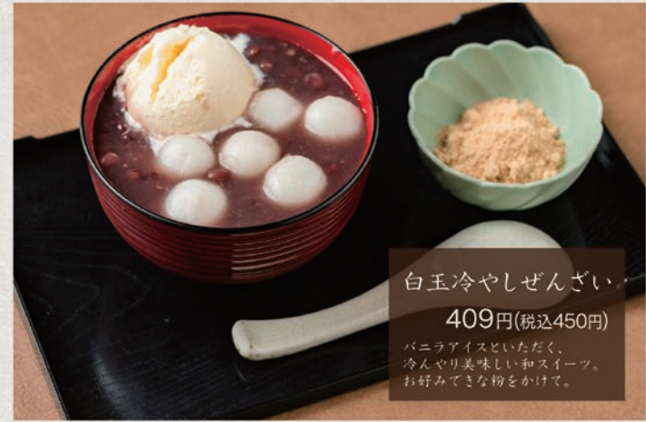
白玉冷やしぜんざい 409円(税込450円) バニラアイスといただく、 冷んやり美味しい和スイーツ。 お好みできな粉をかけて。