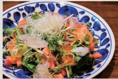
海鮮サラダ 818円 (税込900円)