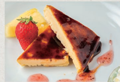
海峡カタラーナ 455円(税込500円)