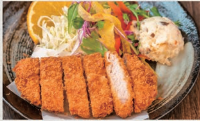
熟成三元豚とんかつ 1000円 (税込1100円)